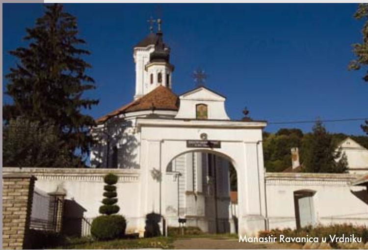
Manastir Ravanica u Vrdniku