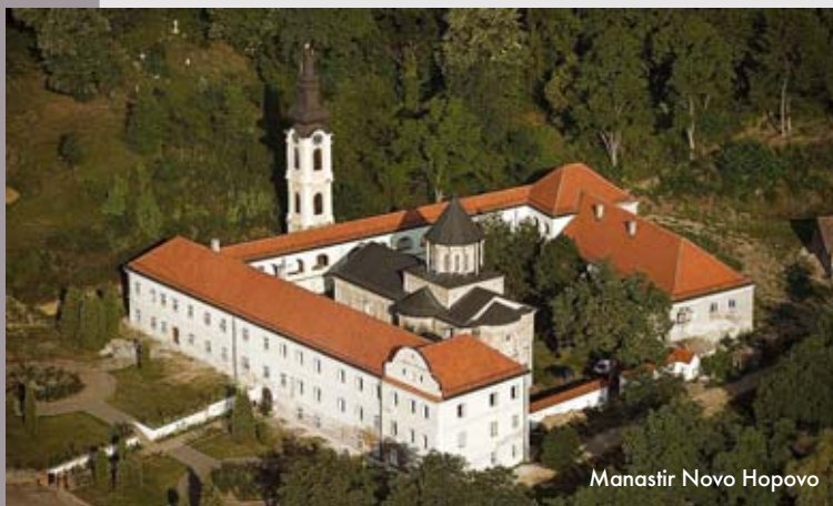
Manastir Novo Hopovo