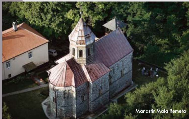
Manastir Mala Remeta