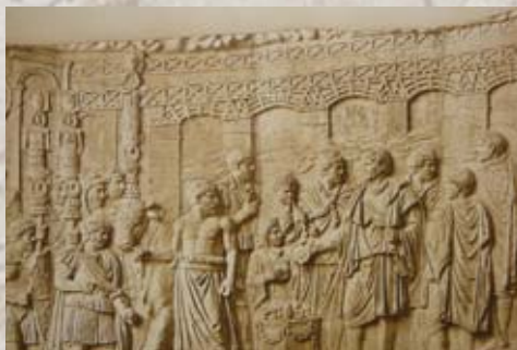
Most na Dunavu na Trajanovom stubu u Rimu

Đerdapsku klisuru, započet još za Tiberijeve vladavine, načinio kanal kojim je plovidba kroz Đerdap učinjena bezbednom, u blizini današnjeg Karataša podigao utvrđenje Dijanu koji je ovaj kanal obezbeđivao (ostaci ove tvrđave i danas postoje i nalaze se neposredno pored hidroelektrane "Đerdap I"), a nedaleko od današnjeg Kladova, odnosno Turnu Severina u Rumuniji, sagradio jedno od najznačajnijih dela rimskog građevinarstva – most na Dunavu. Po završetku puta kroz klisuru, Trajan je naredio da se u stenu iznad puta ukleše natpis: "Imperator cesar, sin božanskog Nerve, Nerva Trajan Avgust, pobednik nad Germanima, veliki pontif, četvrti put postavljen za tribuna, otac domovine, konzul po treći put, planine je isklesao i postavio grede od kojih je napravljen ovaj put". Ova kamena, takozvana Trajanova tabla, dugačka 3,2 i visoka 1,8 metara, i danas stoji u Đerdapskoj klisuri, 2,5 km uzvodno od Tekije, ali ne na originalnom mestu. Naime, izgradnjom hidroelektrane "Đerdap" podignut je nivo Dunava i potopljen je antički rimski put, a Trajanova tabla isečena i ponovo postavljena dvadesetak metara više. Danas je vidljiva samo s reke.