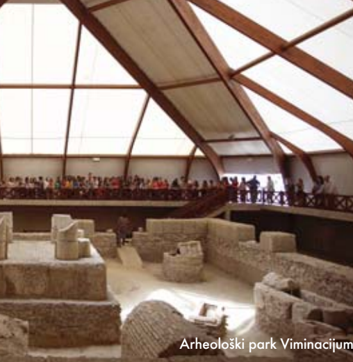
Arheološki park Viminacium

Viminacium je bio prostor gde su izvršena i prva arheološka iskopavanja u Srbiji. Bilo je to 1882. godine i njih je započeo Mihailo Valtrović, arhitekta po profesiji i prvi profesor arheologije na tadašnjoj Visokoj školi, i to uz pomoć