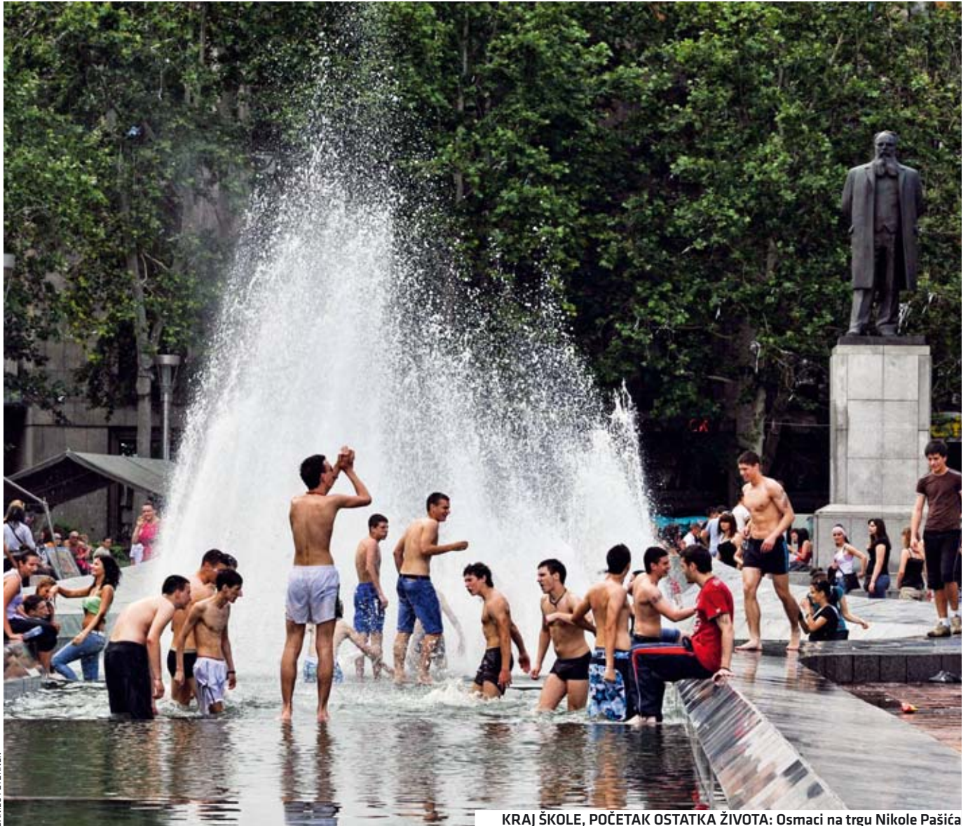
KRAJ ŠKOLE, POČETAK OSTATKA ŽIVOTA: Osmaci na trgu Nikole Pašića

Ove godine, osnovno obrazovanje okončaće 80.000 učenika u Srbiji. Kao i prethodnih pet godina, i ovoga puta u srednjim školama je veći broj slobodnih mesta nego što ima kandidata. Međutim, to ne znači da će se sva deca upisati baš tamo gde žele. U pojedinim školama na jedno slobodno mesto konkuriše i po sedam đaka. Potreba da se završi "nešto konkretno" visoko je rangirala ogledne profile u stručnim srednjim školama na listi najtraženijih među osmacima. Prethodnih godina, takođe, veoma popularne su bile ekonomske, pravnobirotehničke i medicinske škole, kao i gimnazije, a ove škole su i tradicionalno tražene. Po svemu sudeći, veliki broj budućih srednjoškolaca, za četiri godine, kada izađu iz školskih klupa, već će nešto biti po profesiji. To znači da su već sada, sa četrnaest godina, u neku ruku, odabrali čime će se baviti