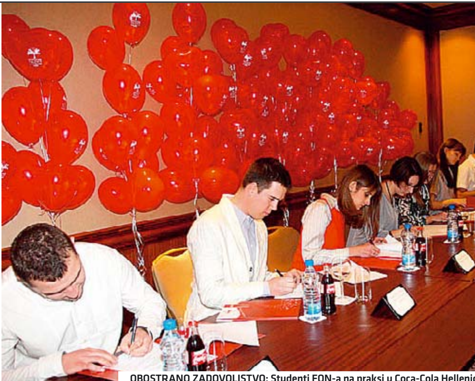
OBOSTRANO ZADOVOLJSTVO: Studenti FON-a na praksi u Coca-Cola Hellenic

Saradnja između privrede i obrazovnih institucija u razvijenim zemljama odavno nije novost. Kod nas su ovakvi oblici partnerstava još retkost, ali ima naznaka da će se i oni uskoro razviti