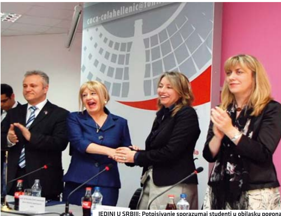
JEDINI U SRBIJI: Potpisivanje sporazumai studenti u obilasku pogona

objektima. U proizvodnji, poboljšanje operativne efikasnosti sistema kroz praćenje vremena, pokreta, kao i izrade kataloga za operacije i mašine. Program “Menadžeri na fakultetu” sastoji se od četrnaest predavanja koja na FON-u studentima menadžmenta drže stručnjaci iz različitih oblasti. Do sada je ova predavanja odslušalo 230 studenata druge godine studija menadžmenta.