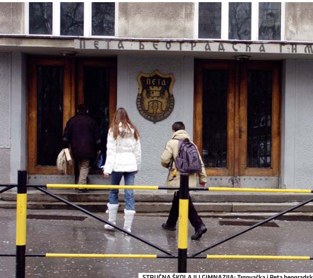
STRUČNA ŠKOLA ILI GIMNAZIJA: Trgovačka i Peta beogradska