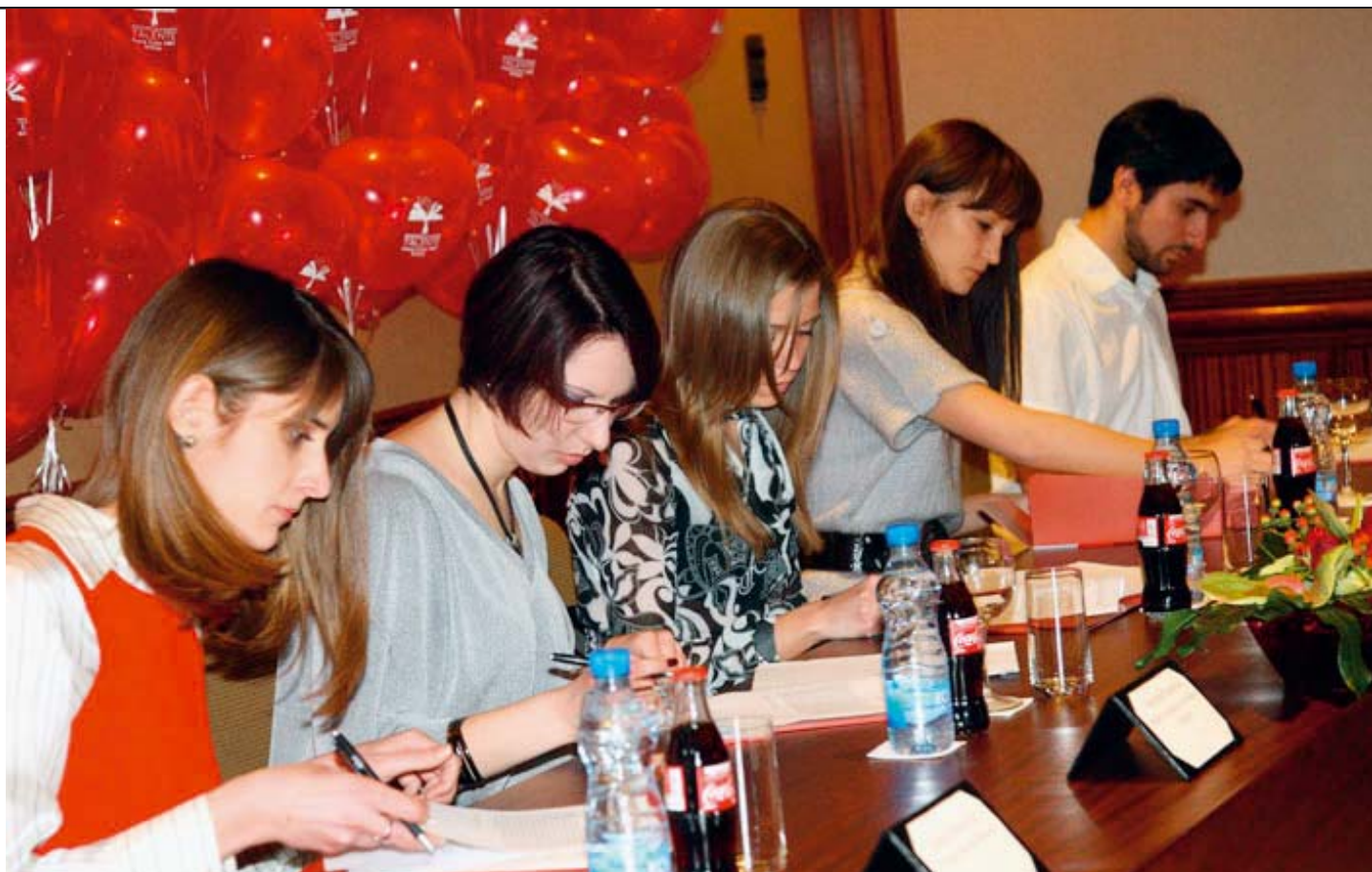
PRILIKA ZA CILJ: Koka-kola talenti

Poslovi višu nisu statični i isti za ceo život. Unutar kompanije prolazi se kroz različite sektore, pozicije, poslove, a vrata za usavršavanje se otvaraju na raznim poljima. Upravo u toj dinamičnosti krije se draž i mogućnost da zaposleni otkriva i gradi svoje veštine, a sa razvojem ljudi napreduje i sistem