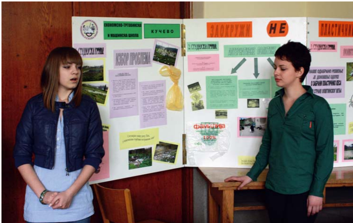
"UBAČENO" U ŠKOLE: Čas građanskog vaspitanja