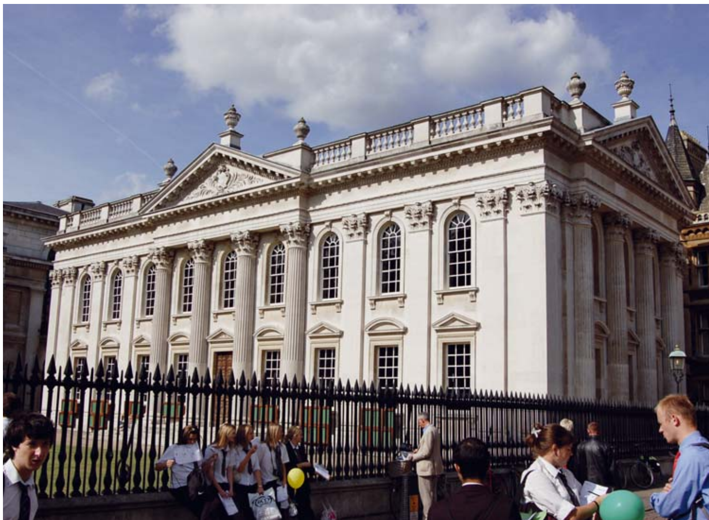
UNIVERZITET KEMBRIDŽ, VELIKA BRITANIJA