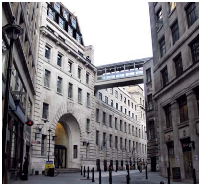
ZGUSNUT RASPORED: London School of Economics

studijama, koje sam upisao nakon mastera, situacija sa vremenom nije bolja.