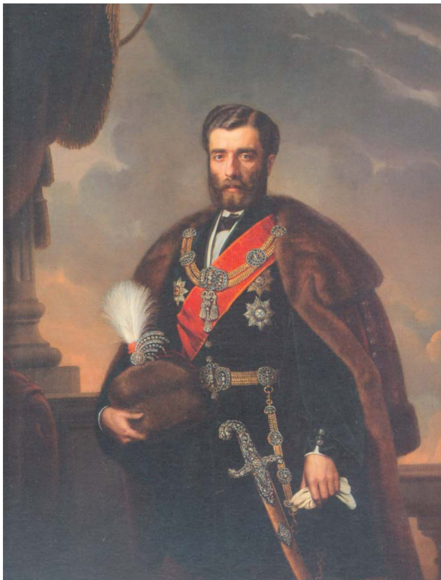
Knez Mihailo Obrenović

Ali kao u basni o lisici i rođi ili u priči o štapi i šargarepi, kada je napokon i običnom seljaku bio dostupan povoljan kredit, javljaju se nove "otežavajuće okolnosti". Naime, Uprava nije imala filijale po unutrašnjosti zemlje, nego samo centralu u Beogradu, gde se usled komplikovanog postupka odobravanja zajma on nije mogao odmah realizovati. A kako siromašni zemljoradnik nije mogao podneti dodatne troškove odlaska i boravka