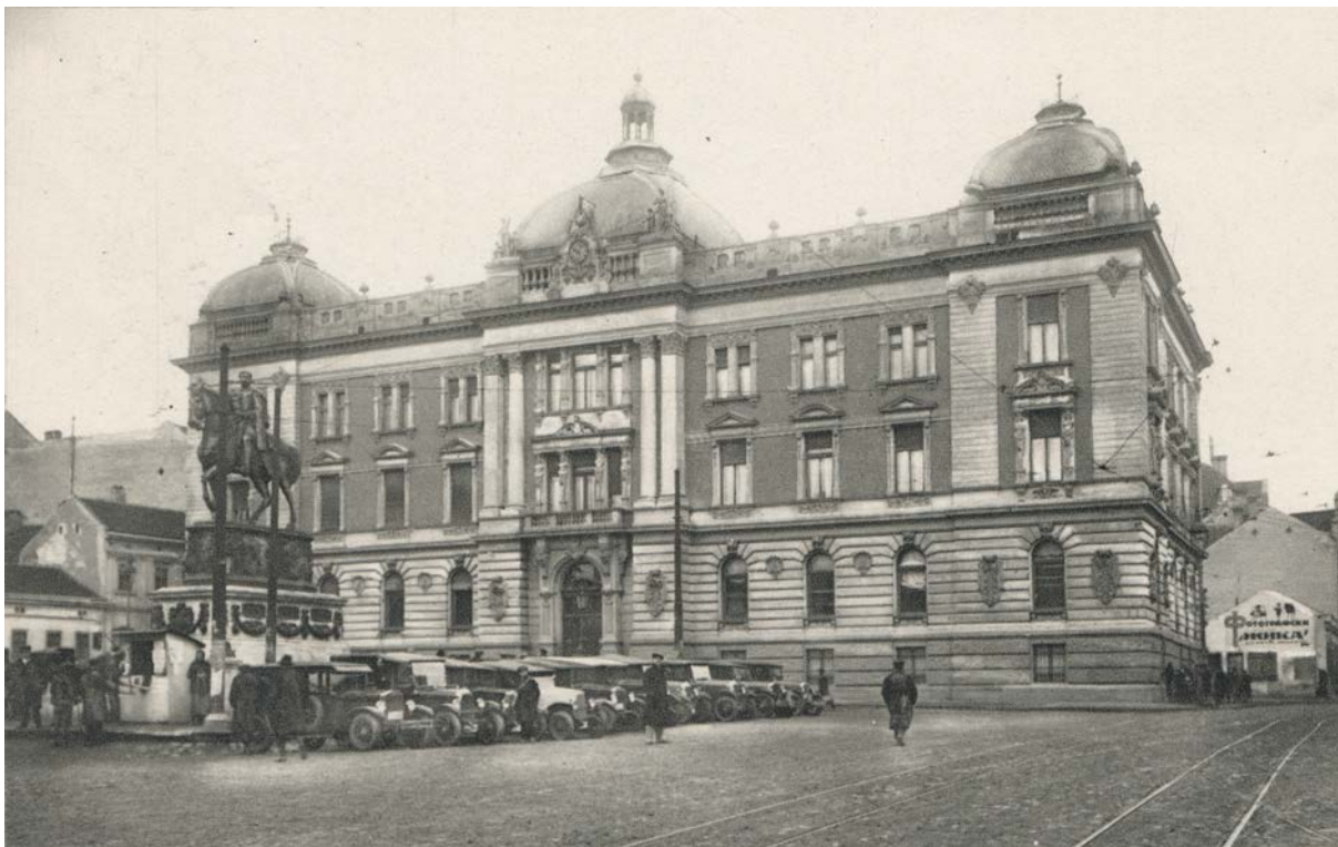
Narodni muzej: Bivša zgrada Uprave fondova

Nakon Svetoandrejske skupštine, prve srpske "slavne revolucije", u narodu se javila nada da će ponovni dolazak Obrenovića na vlast označiti početak korenitih reformi u privredi i društvu, s obzirom na to da su korupcija i zelenaštvo bili prisutni na svakom koraku. Otuda je druga Miloševa vlada odmah započela s reformama pravosudnog sistema – donošenjem Zakona o sudskom postupku i novog Kaznitelnog zakonika, a njegov sin i nasljednik Mihailo s organizovanjem legalnog bankarskog sistema – ne bi li "zaduženom narodu omogućio put da se lakše odužiti može". Tako su Mihailovim ukazima od 16. i 24. avgusta 1862. godine doneti Zakon o Upravi fondova i Zakon o davanju novca pod interes iz kase Uprave fondova, kojima zapravo otpočinje istorija bankarstva u Srbiji.