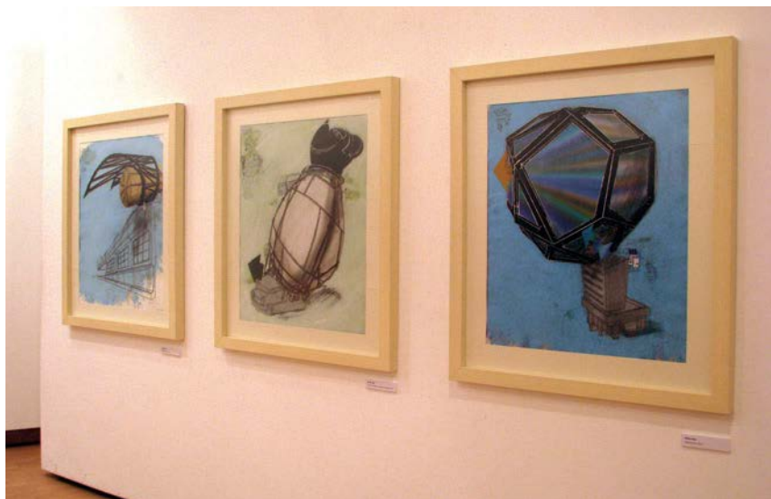
“O’ZVUČENJE”: Detalj sa izložbe

Otkupljivanjem radova savremene umetnosti od neafirmisanih, ali talentovanih mladih umetnika, kompanija Wiener Städtische osiguranje je pokrenula specifičnu kolekciju u kojoj je već više od 70 umetničkih dela. Misija ovog dugoročnog projekta je podsticanje savremene umetnosti, ali i stvaranje kulturnog dobra za budućnost