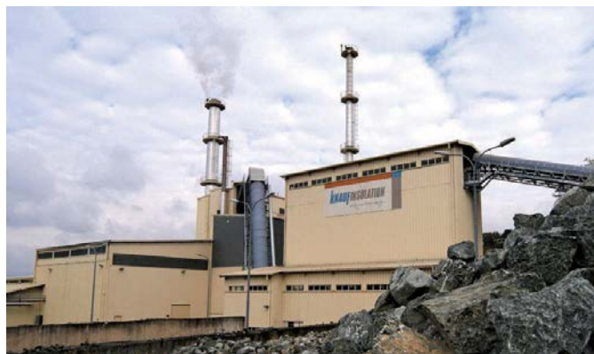
Fabrika Knauf Insulation u Surdulici

Surdulička fabrika za proizvodnju termoozolacionog materijala kamene vune Knauf Insulation izvezla je prvi kontigent svojih proizvoda u Saudijsku Arabiju. Ovo je prvi projekat u okviru kojeg će na Bliskom istoku u izgradnji biti korišćeni srpski proizvodi i on obuhvata dopremanje čak 30 kontejnera, odnosno 29.000 kvadratnih metara kamene mineralne vune.