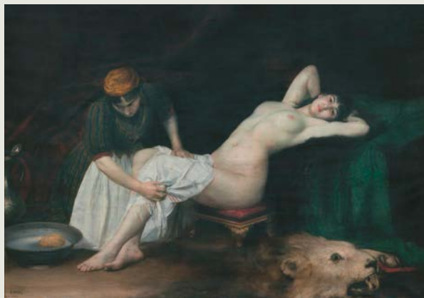
Vlaho Bukovac, Velika Iza , 1892, Spomen zbirka Pavla Beljanskog

preko više od trideset imena umetnika generacije koja je stasavala između dva svetska rata, živela i izlagala u Parizu i Beogradu, kao i drugim jugoslovenskim gradovima i na mnogobrojnim inostranim izložbama. To su istovremeno umetnici koji su svojim nastupima u svetu posle Drugog svetskog rata odigrali značajnu ulogu u propagiranju jugoslovenske kulture, a kao likovni pedagozi su učestvovali u formiranju mnogih budućih umetničkih generacija. Ima previše imena da bi se sva navodila, ali da pomenemo bar neka: Savu Šumanovića, Milana Konjovića, Petra Dobrovića, Jovana Bijelića, Mila Milunovića, Rista Stijovića, Sretena Stojanovića... Kolekcija Pavla Beljanskog se prepoznaje po Bijelićevoj Devojci s knjigom , Šumanovićevom Doručku na travi , Konjovićevoj Žetvi , Resniku Nadežde Petrović , Crvenoj terasi Milana Milovanovića, Dečaku s belim šeširom Koste Miličevića, Mrtvoj prirodi Mila Milunovića, Velikoj Izi Vlaho Bukovca kao delima koja se godinama reprodukuju u školskim udžbenicima i svim pregledima istorije umetnosti.