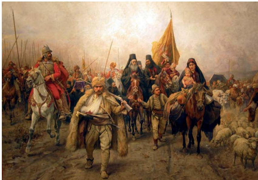
Paja Jovanović, Seoba Srba , 1896

zatim istorijska dela Kosovka devojka , Hercegovački begunci i Na Studencu . Uradio je portrete predsednika Akademije Sime Lozanića, Stojana Novakovića, Jovana Žujovića, Jovana Cvijića, Đorđa Vajferta, Slobodana Jovanovića, Bogdana Gavrilovića i Aleksandra Belića. Oslikao je više ikonostasa i smatra se poslednjim značajnim srpskim ikonopiscem. U Narodnom muzeju u Zrenjaninu nalazi se soba Uroša Predića, i 900 njegovih crteža, za-pisa i ličnih stvari.