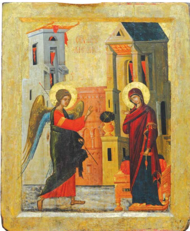
Blagovesti, 16 vek.

Umetnost 18. veka na tlu Vojvodine obeležili su prožimanja i smene baroknog i prosvetiteljskog kulturnog modela