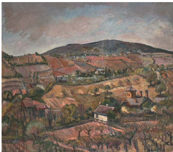
Petar Dobrović, Baranjski vinogradi , 1915