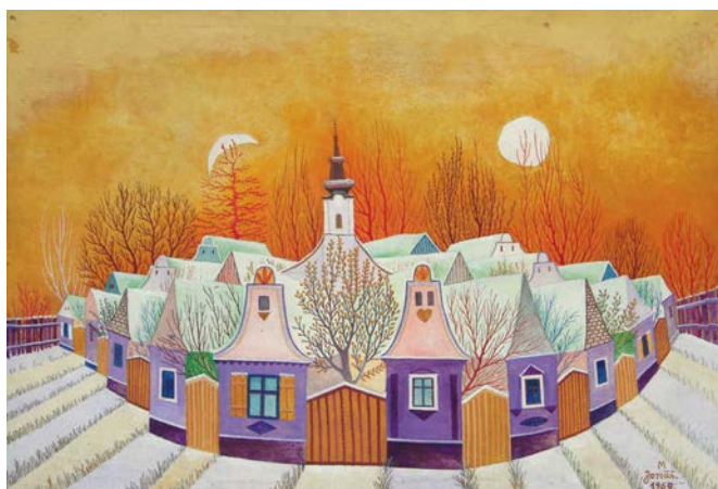
Martin Jonaš, Moja Kovačica , 48×68, 1969