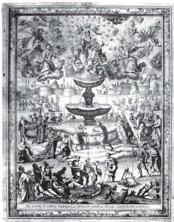
Hristofor Žefarović, Bogorodica živonosni istočnik , 1745.