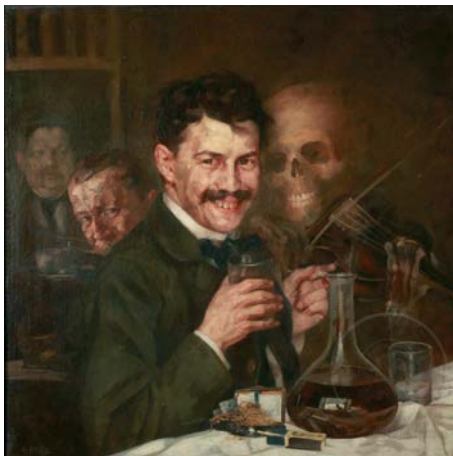
Stevan Aleksić, Autoportret u kafani , 1904