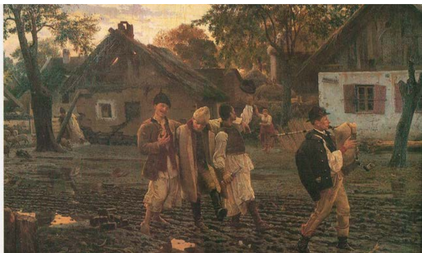
Uroš Predić, Vesela braća žalosna im majka

novog društva, a i udovoljavaju potrebi građana da ovekoveče svoje likove. Slikaju ih u duhu najboljeg evropskog klasicizma čiji su izraziti predstavnici Arsenije (Arsa) Teodorović i Pavel Đurković. Teodorovićev portret Dositeja iz 1794. je prvi građanski portret u srpskom slikarstvu.