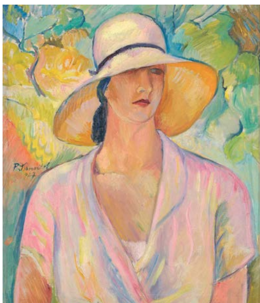
Petar Dobrović, Figura , 1927

Vojvođanski tekstualizam i konceptualizam, odnosno nova umetnost sedamdesetih, pojava je koja na vojvođanskoj umetničkoj sceni čini odlučni otklon i od lokalnog umerenog modernizma i od domaćeg enformela. Umetnički radovi nisu tradicionalne forme, već se odnose na mentalno područje, telesne akcije,