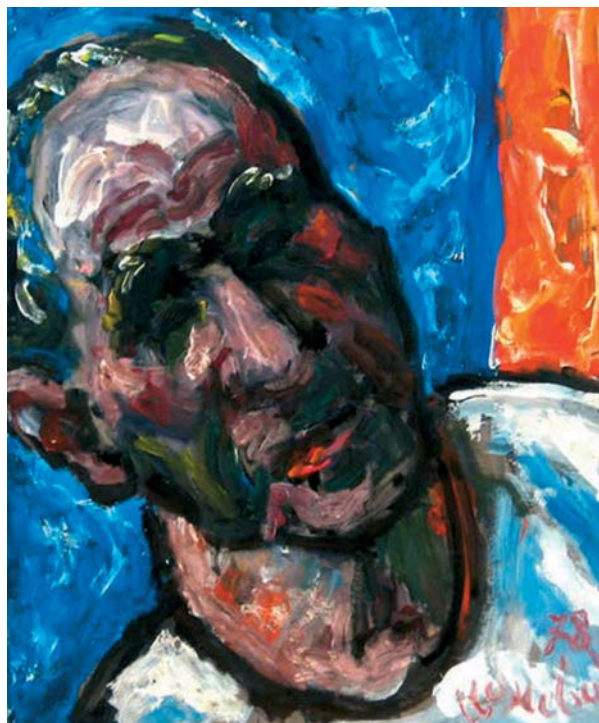
Milan Konjović, Autoportret , 1978