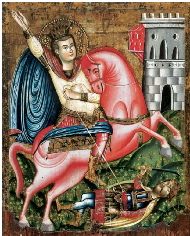
Hristofor Žefarović, Sv. Dimitrije, oko 1740

Vremenske granice umetnosti 18. veka u Vojvodini su Velika seoba 1690. godine i Berlinski kongres 1815. godine, a teritorijalne – centralne oblasti Karlovačke mitropolije. Bila je to epoha prožimanja i smene baroknog i prosvetiteljskog kulturnog modela.