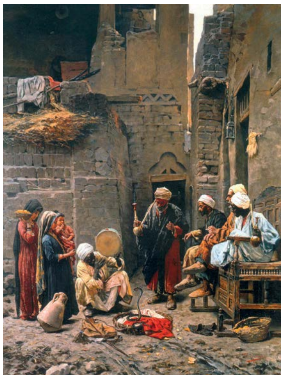
Paja Jovanović, Ukrotitelj zmija , 1887