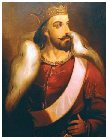
Đura Jakšić, Car Dušan , 1856