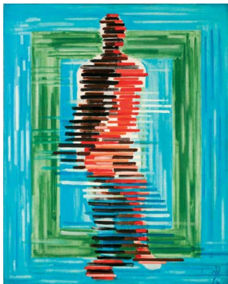
Jožef Ač, Kretanje u istom prostoru , 1976