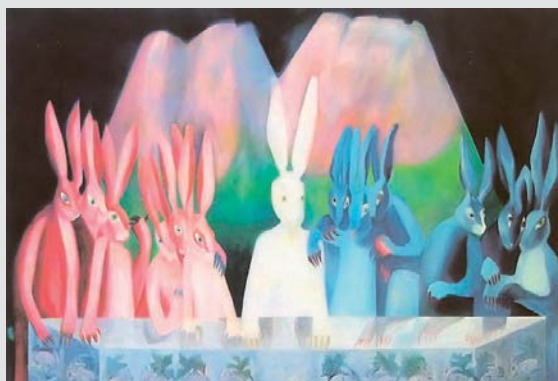
Nikola Džafro, Zečevi

Neke od ideja novosadskih konceptualnih umetnika koji su se tokom sedamdesetih okupljali oko grupa KOD, (E i (E-KOD, možemo pronaći u radu Art klinike . To je utopiistički projekat grupe građana osnovan 2002. godine u Novom Sadu. Stožer Led arta i Klinike je Nikola Džafro, multimedijalni umetnik. Osnovani su s uverenjem da umetnost može da menja svet – zato sebe smatraju utopističkim projektom. Dragana Garić objašnjava da su njihove prezentacije bile angažovane, kritikovali su režim, bavili su se socijalnim pitanjima: "Art klinika je vremenom izrasla u multimedijalni centar, dobili su prostor, otvorili Šok galeriju u kojoj organizuju izložbe, predavanja, performanse, imaju prodavnicu, knjižaru, i sve s ciljem da promene i prodrmaju kulturnu politiku, i da javnost zainteresuju za umetnost"