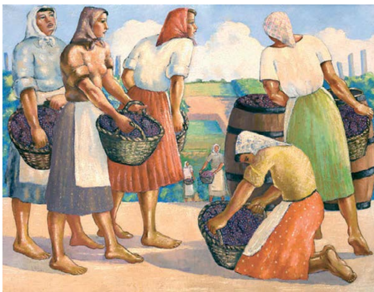
Sava Šumanović, Beračice , 1942