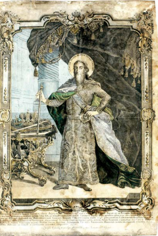
Zaharija Orfelin, Sv. Lazar knez srpski , 1773

Galerije, u novinskom oglasu 1847. godine s molbom da “novoosnovanom Muzeumu poklanjaju ili poveravaju na čuvanje sve one predmete koji doprinose obogaćivanju narodnog duha i služe njegovom kulturnom napretku”.