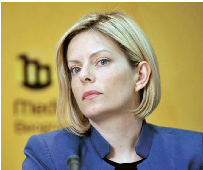
PRUŽA SE PRILIKA DA SE TEMA BALKANA POGURA NA LISTI PRIORITETA EU: Hedvig Morvai

Ako se nastavi proces postepenog i sporog pridruživanja uz stalno pooštavanje uslova za članstvo kao i uz rastući skepticizam među građanima država članica EU u pogledu daljeg širenja, postoji opasnost da nijedna država Zapadnog Balkana ne bude primljena u članstvo pre kraja ove decenije, pa čak i da se proces u potpunosti zaustavi. Ovo, naravno, ide na ruku onima koji u državama regiona ostvaruju svoje interese, velike zarade i visok profit radeći van pravila EU koja predviđaju veću konkurenciju, ili političkim profiterima koji će izbegavati usvajanje i primenu pravila ako se plaše negativnih posledica u smislu gubitka podrške na sledećim izborima. Zato, ako se želi konsolidovati razvoj u ovim državama, važno je insistirati na procesu EU integracija, jer je to mehanizam koji dokazano vodi do napretka. Proces je dobar, i treba ga iskoristiti kao istorijsku šansu da se ove države dovedu u red. Međutim, mora da se razmisli o strateškim promenama ovog procesa. Što više cilj pridruživanja EU podseća na pokretnu metu, veća je i verovatnoća da će se na taj način smanjiti posvećenost balkanskih političkih lidera reformama kao i podrška naroda ovih država evropskim integracijama.