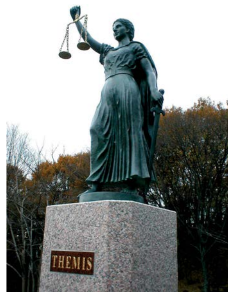
VEĆINA DOKUMENATA SU MRTVO SLOVO NA PAPIRU: Themida, grčka boginja prava i pravde

U junu 2010. godine usvojen je Posebni protokol Ministarstva zdravlja Republike Srbije za zaštitu i postupanje sa ženama koje su izložene nasilju. Posebni protokol je instrument za prepoznavanje, evidentiranje i dokumentovanje rodno zasnovanog nasilja, sa ciljem da se zdravstveni radnici/e uključe i reaguju na planu otkrivanja, suzbijanja