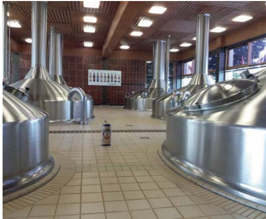
Jedini sastojci su voda, slad, hmelj i kvasac: Erdinger pivara