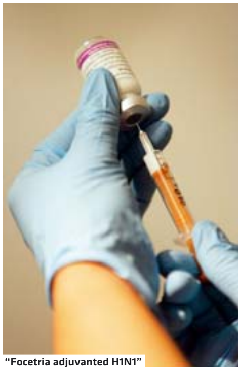
"Focetria adjuvanted H1N1"