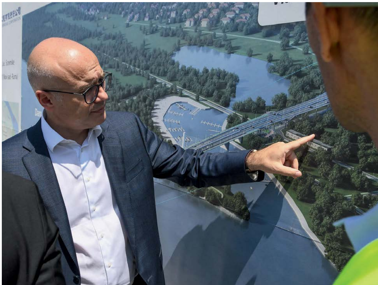
PLAN MOSTA, MIMO KVALITETA ŽIVOTA: