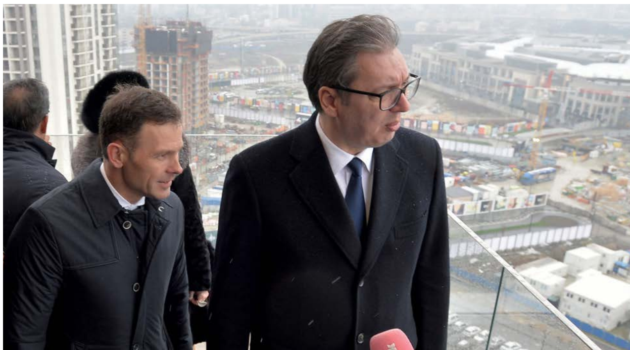
PONOSNI NEIMARI: S. Mali i A. Vučić obilaze radove u Beogradu na vodi

I kroz šta sve smo morali da prođemo da bismo do toga došli? Protiv mene se vodi trideset sudskih procesa trenutno. Od toga, poslednja dva su od “Milenijum tima”, koji su me tužili za 200.000 evra. Da stavimo i to po strani. Meni je drago što kad me ljudi sretnu na ulici kažu “bravo”. Treba od toga da krenemo i da od toga gradimo bazu za dalje. Mi smo neki normalni ljudi koji su se okupili oko nekih vrednosti. Mislimo i znamo da naši gradovi i naša društva mogu bolje, solidarnije i održivije.