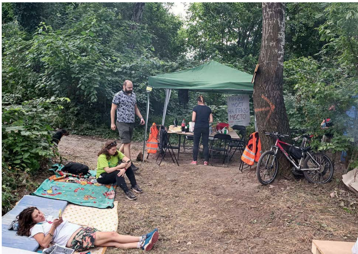
NOVI SAD: Aktivisti u odbrani zaštićenog prirodnog područja Šodroš