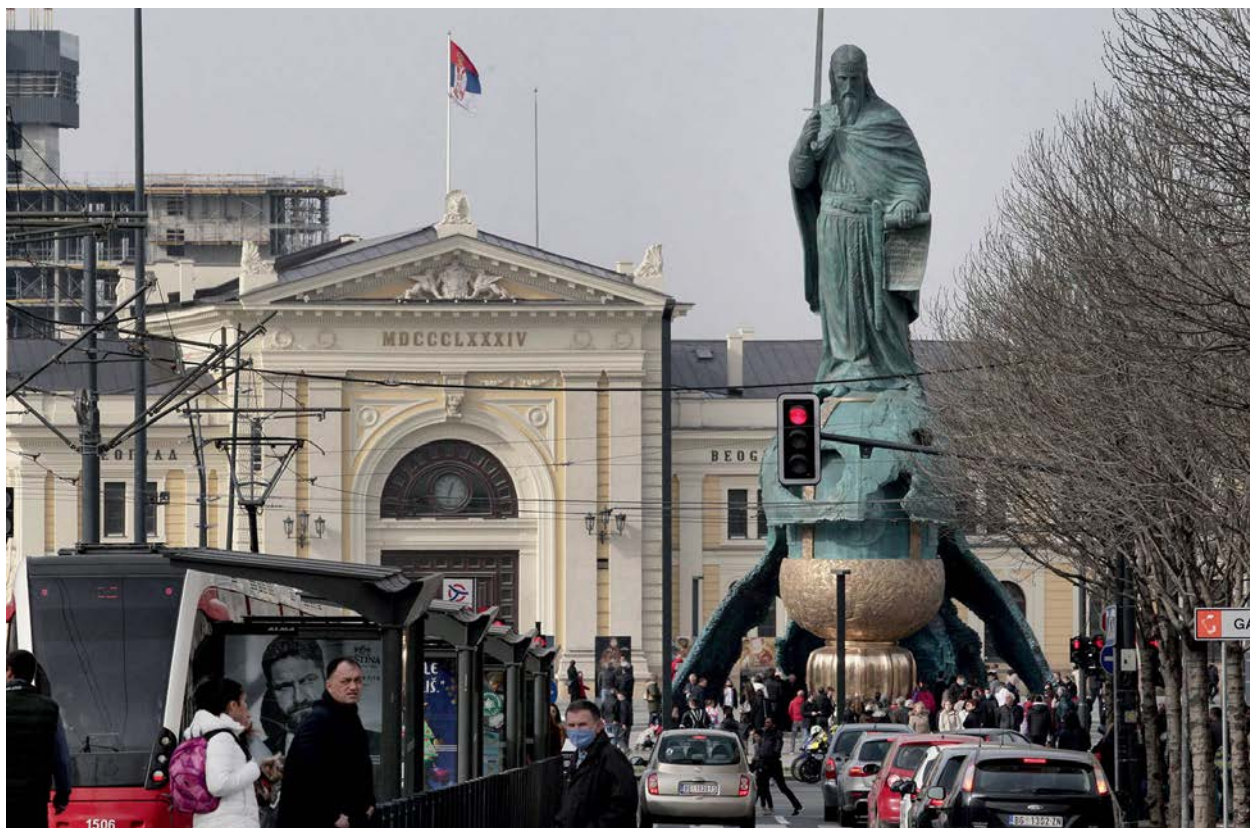
SPOMENIK GDE MU MESTO NIJE: Zatvorena Glavna železnička stanica u Beogradu