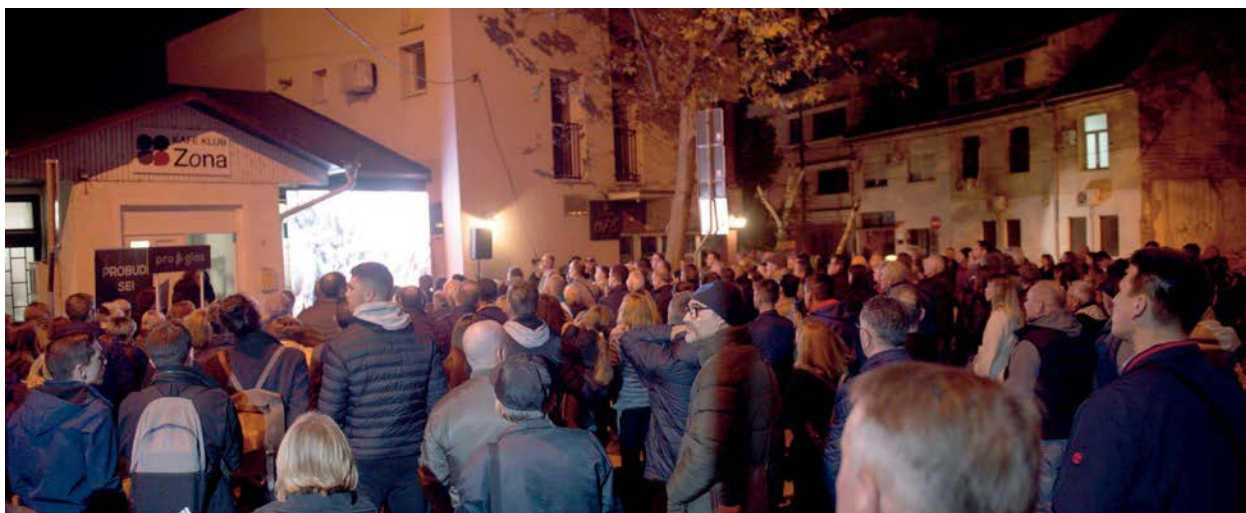
Građani koji nisu uspjeli da uđu u prostorije Zone društvenog dijaloga prate tribinu na video-bimu ispred

ŠVARM: Gospođo Bojković, Zrenjanin se već dvadesetak godina muči sa problemom pijaće vode. Promenile su se vlasti, ali sada je jedna već jedanaest godina tu. Kako je moguće da ljudi toliko dugo nemaju adekvatnu vodu u česmama i da uglavnom ćute? Kako ohrabriti ljude da uzmu olovku i da pokušaju nešto da promene?